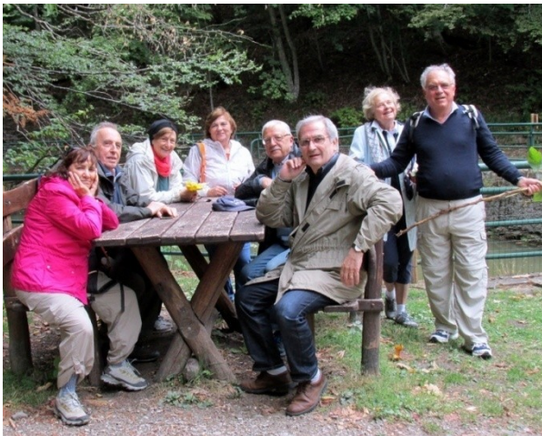
IL GRUPPO DEI CAMMINATORI (2)