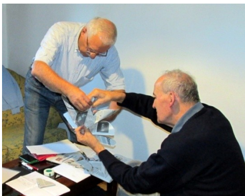
I CANTUCCI AL LAVORO