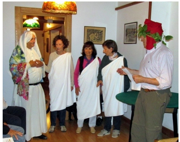
I BISCHERI E LA POESIA SCENEGGIATA (Tanto gentile.....)