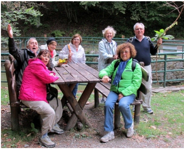
IL GRUPPO DEI CAMMINATORI (1)