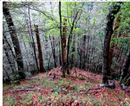
LA MAGIA DELLE FORESTE CASENTINESI

ED ECCO A VOI LE IMMAGINI DELLA 2 GG DI CAMPIGNA