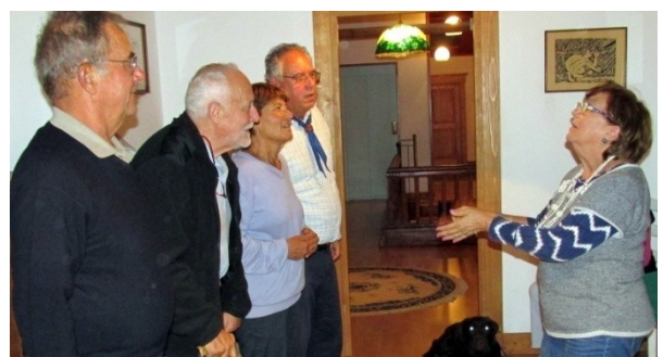
I BAICOLI E LA CANZONE SENZA PAROLE