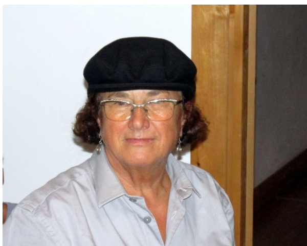
LA MAGISTRA VIGILA INDEFESSA