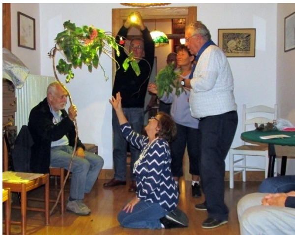
I BAICOLI E LA POESIA SCENEGGIATA (Pianto Antico)