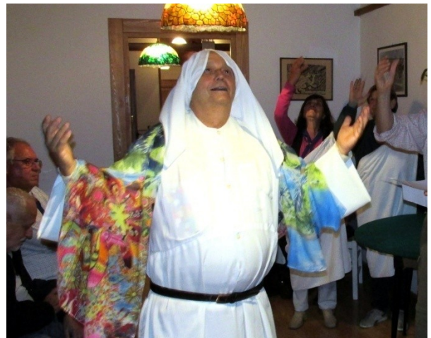
UNA SINGOLARE BEATRICE DANTESCA