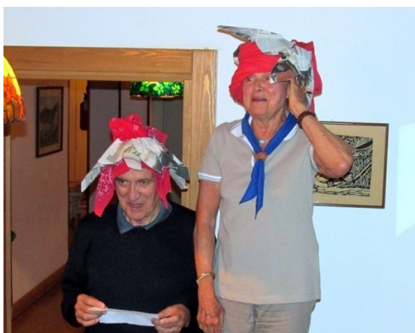
I CANTUCCI E LA CANZONE SENZA PAROLE