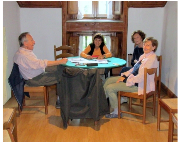
I BISCHERI PREPARANO IL CERCHIO