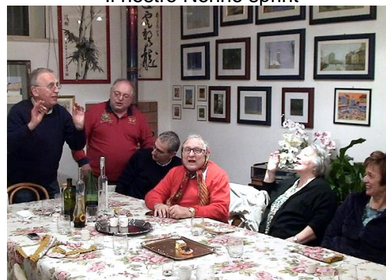
L'intramontabile "Santa Caterina"