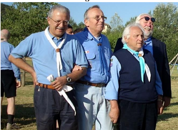
La cerimonia del "Centenario dello Scouting"