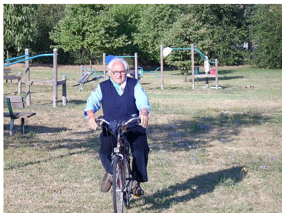
Il nostro Nonno sprint