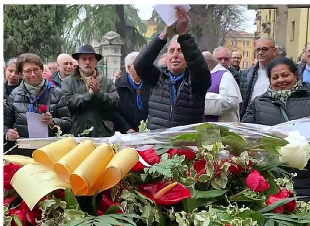
Il saluto finale: tutti cantano la Santa Caterina.