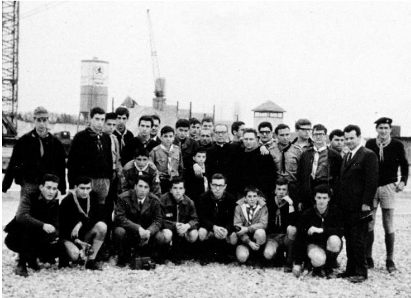
Visita al campo di concentramento di Dachau