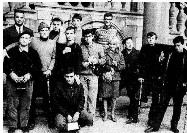
1966 – Campo in Polonia - Czeszokowa