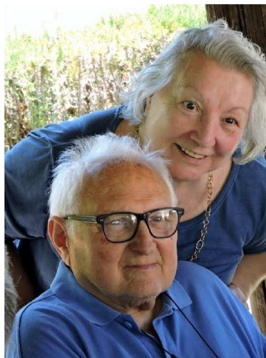
La festa per i 50 anni di matrimonio