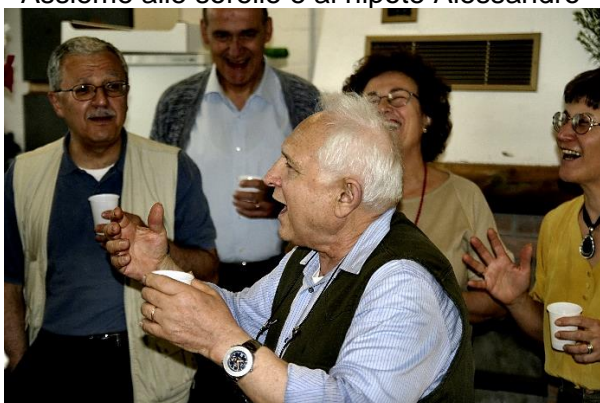
Noi non abbiamo mogli, noi non abbiamo figlie