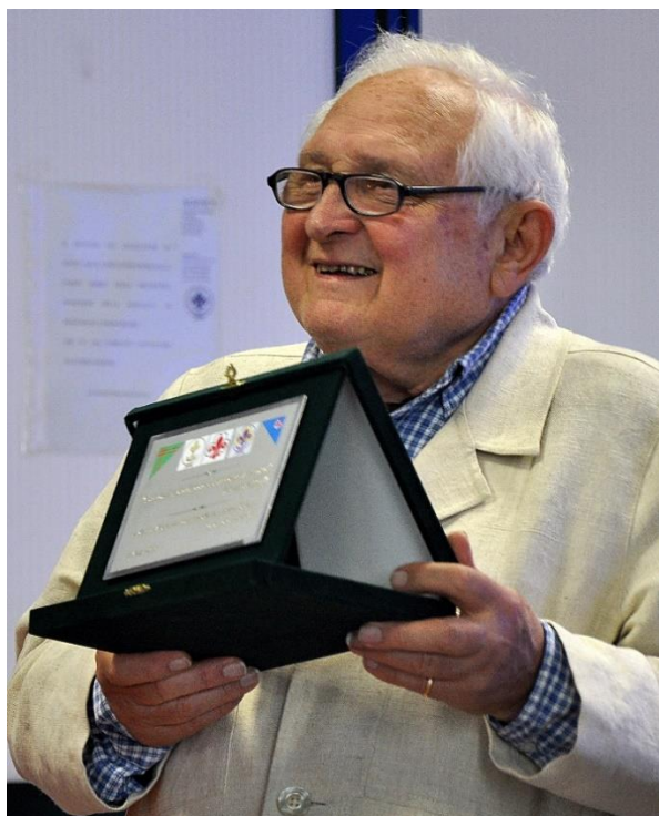
La festa della Comunità per gli 80 anni