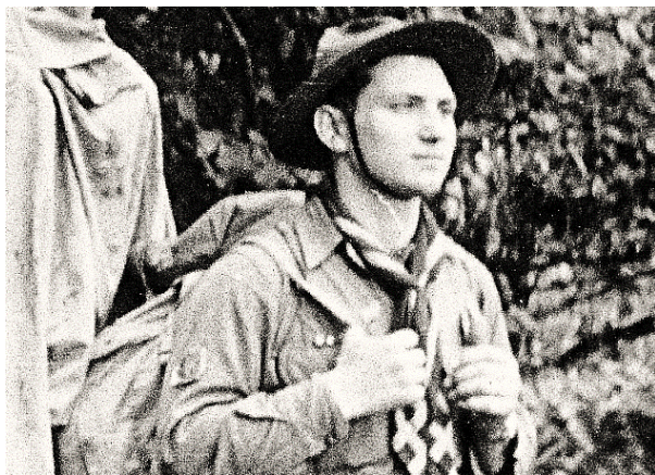
La rinascita dello scautismo bolognese