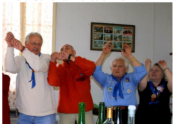
Canti e Danze al Mattarello d'oro