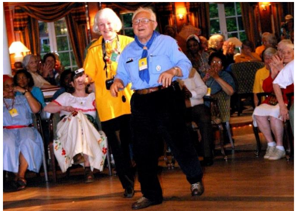
Scatenato ai raduni internazionali