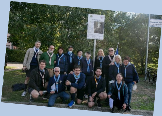
Il MASCI all'inaugurazione del Parco Giovanni Vignali, 2021