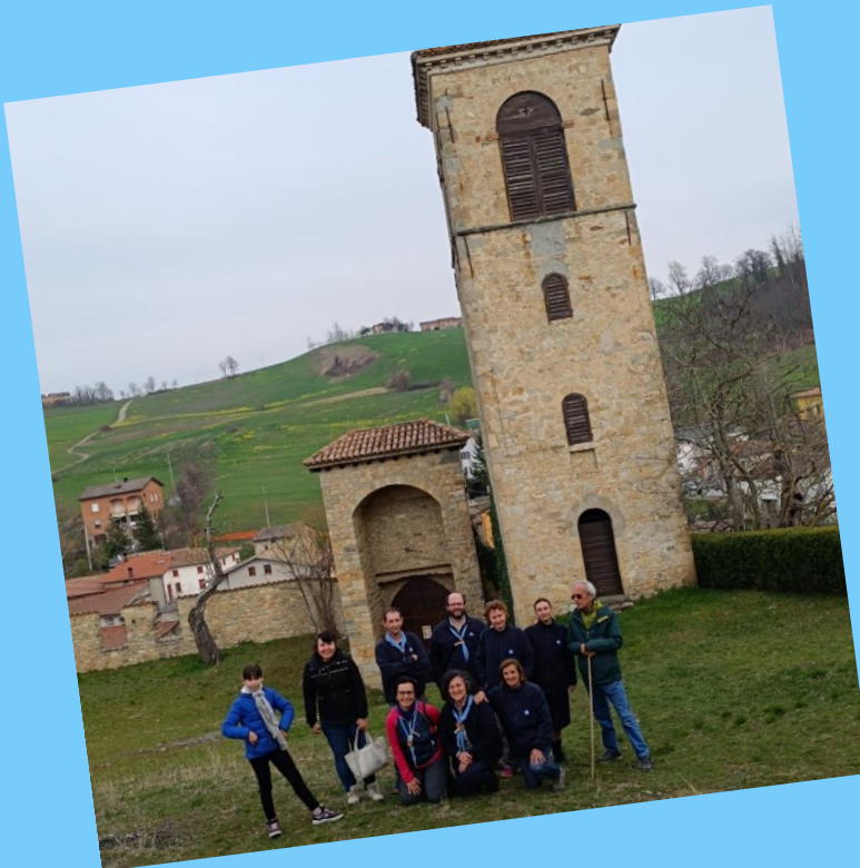
Ph: uscita a Pompeano (MO)