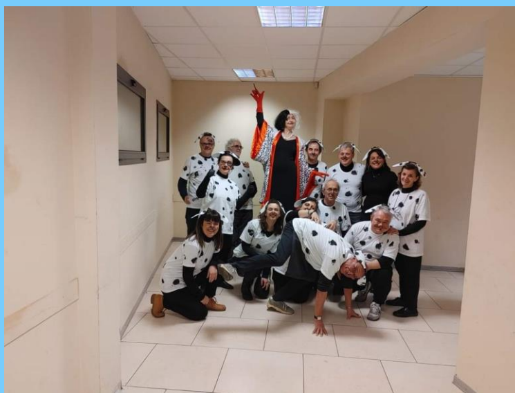
Ph: Polenta di Carnevale

con altri invitati durante il prossimo autunno. La nostra Comunità svolge diverse attività di volontariato , tra cui il servizio al Pranzo Caritas una domenica ogni due mesi, la partecipazione alle raccolte alimentari sul territorio, la polentata con ricavato in beneficenza ogni carnevale, l’aiuto alle iniziative parrocchiali e del gruppo Agesci Sassuolo 3. Nel 2022 ha organizzato un Consiglio Regionale a Sassuolo. La Comunità si ritrova in riunione ogni 20 giorni circa, abitualmente presso la parrocchia Ss. Consolata e per qualunque informazione è possibile contattare il magister al 345.5986226.