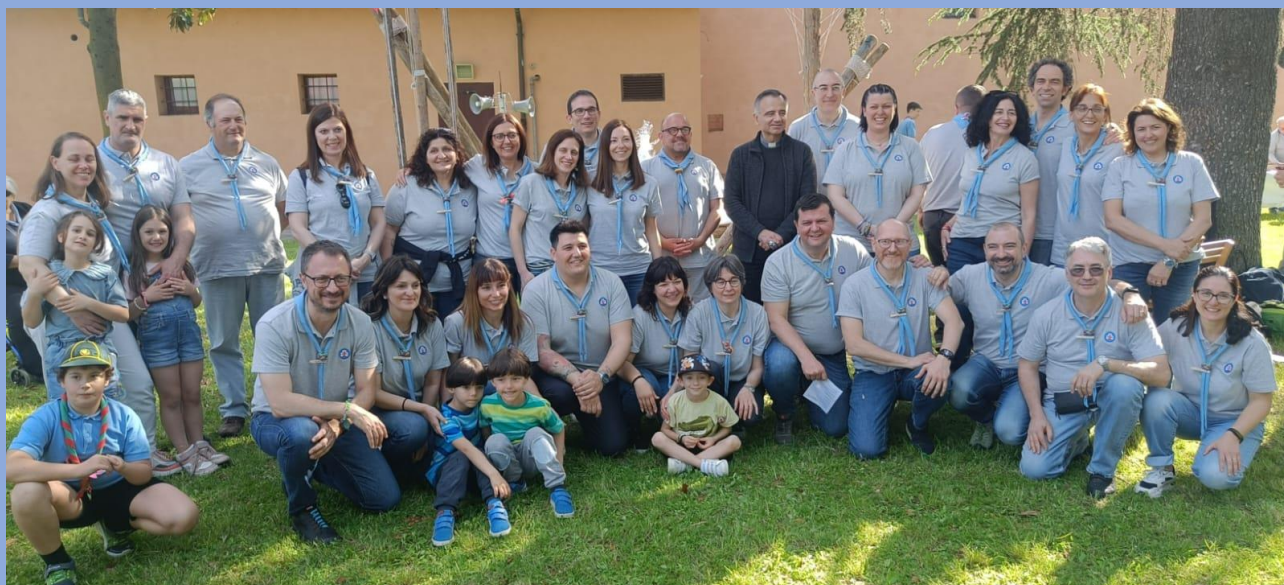
Ph: momenti dell'atto di costituzione della Comunità. Al centro, Mons Erio Castellucci, vescovo di Modena-Nonantola-Carpi, settembre 2023